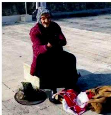
Una tanto amata... vecchietta Chi la rappresenta fa a gara per far ridere tutti

prevederlo una indagine di Cna Turismo e Commercio condotta tra gli iscritti di tutta Italia dalla quale emerge anche la presenza sul territorio nazionale di circa 800.000 vacanzieri stranieri. Un giorno, questo 6 gennaio, dedicato anche agli ultimi regali, agli ultimi... pensierini e agli auguri che ormai ci scambiamo con gioia e in ogni occasione da quasi