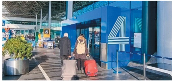
A Fiumicino molte le partenze e gli arrivi dei vacanzieri

ARTICOLO NON CEDIBILE AD ALTRI AD USO ESCLUSIVO DEL CLIENTE CHE LO RICEVE - 4462