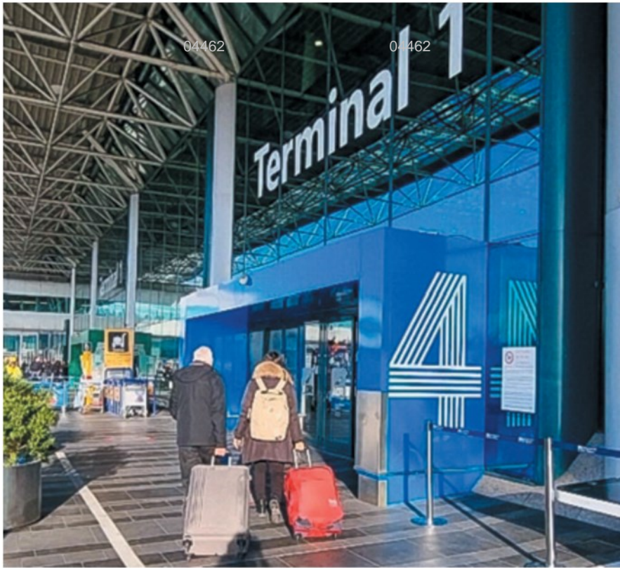
Il Terminal 1 dell'Aeroporto di Roma Fiumicino