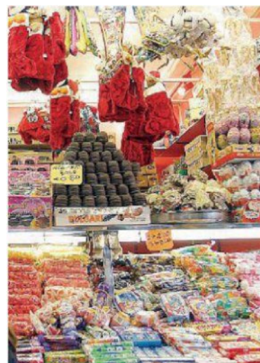
Epifania Dolciumi e giocattoli dominano nel Meridione

Stimati da Cna 2,5 milioni di pernottamenti fra alberghi, B&B e agriturismo. Buona parte dei turisti si recherà nelle seconde case, soprattutto in località sciistiche, o limiterà la vacanza a gite di un giorno. Ovvero una semplice pausa.