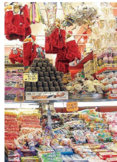
Epifania Dolciumi e giocattoli dominano nel Meridione

Stimati da Cna 2,5 milioni di pernottamenti fra alberghi, B&B e agriturismi. Buona parte dei turisti si recherà nelle seconde case, soprattutto in località sciistiche, o limiterà la vacanza a gite di un giorno. Ovvero una semplice pausa.