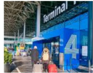
Fiumicino Molte le partenze ANSA

Stimati da Cna 2,5 milioni di pernottamenti fra alberghi, B&B e agriturismo. Buona parte dei turisti si recherà nelle seconde case, soprattutto in località sciistiche, o limiterà la vacanza a gite di un giorno. ●