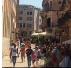
Presenze turistiche in regione

Condizioni atmosferiche permettendo, saranno non meno di sette milioni i turisti che si metteranno in viaggio tra oggi (ma in tanti sono già partiti nel pomeriggio di ieri) e dome-