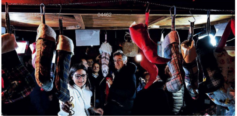
La befana vien di notte... Fin da piccoli siamo stati abituati alla festa dell'Epifania, ultima occasione d'inizio anno per ricevere dolci e tanti regali