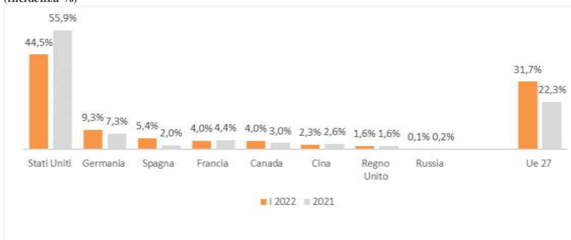
Figura 3 – La rilevanza delle varie aree di destinazione delle vendite di prodotti agroindustriali sardi (incidenza %)

Tra i mercati di sbocco europei, quello tedesco è il più rilevante in termini economici, rappresentando più del 9% nel primo trimestre 2022, mentre quello spagnolo è il più dinamico, cresciuto da 224mila euro a quasi 2,5 milioni di valore di merci acquistate, per effetto di una domanda fortemente concentrata sui prodotti a base di carne lavorata e conservata. Molto espansiva anche la domanda proveniente dal Regno Unito, sebbene i livelli siano ancora molto modesti (1,6% del totale).