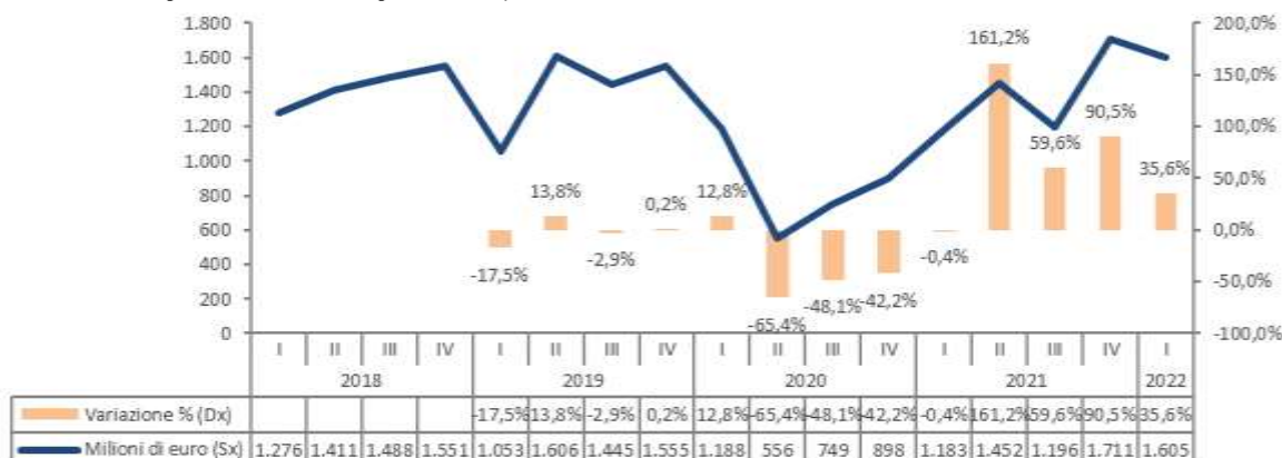
Figura 1 – Andamento delle esportazioni trimestrali in Sardegna (milioni di euro e variazione percentuale rispetto allo stesso periodo dell'anno precedente)

flessione, anche più rilevante, dell'export nel periodo più recente, ovvero Basilicata e Molise, con un calo rispettivamente del 13,5% e 23,5%.