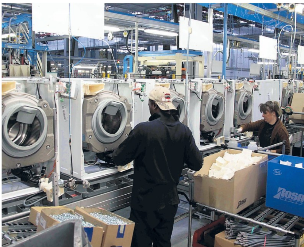
Produzione sospesa per alcune linee dello stabilimento dell'Electrolux di Porcia (Pordenone)